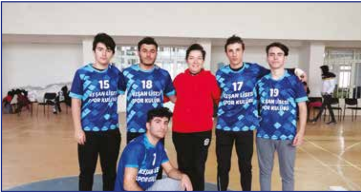
Badminton İlçe Birincisi Keşan Lisesi