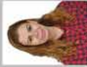
NİSPETİYE ÇELEBİ İNGİLİZCE