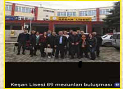
Keşan Lisesi 89 mezunları buluşması