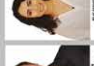
NİSPETİYE İNGİLİZCE ÖĞRETMENİ