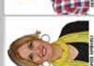
NİSPETİYE İNGİLİZCE ÖĞRETMENİ