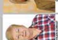
NİSPETİYE İNGİLİZCE ÖĞRETMENİ