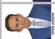
NİSPETİYE İNGİLİZCE ÖĞRETMENİ