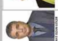
NİSPETİYE İNGİLİZCE ÖĞRETMENİ