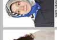
NİSPETİYE İNGİLİZCE ÖĞRETMENİ