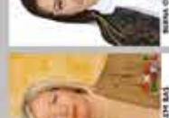
NİSPETİYE İNGİLİZCE ÖĞRETMENİ