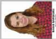
NİSPETİYE İNGİLİZCE ÖĞRETMENİ