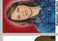
NİSPETİYE İNGİLİZCE ÖĞRETMENİ