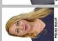
NİSPETİYE İNGİLİZCE ÖĞRETMENİ