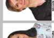
NİSPETİYE İNGİLİZCE ÖĞRETMENİ