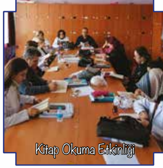
Kitap Okuma Etkinliği