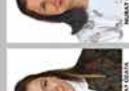
NİSPETİYE İNGİLİZCE ÖĞRETMENİ