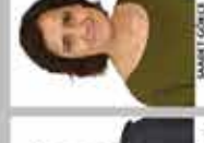
NİSPETİYE İNGİLİZCE ÖĞRETMENİ