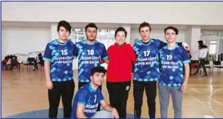
Badminton İlçe Birincisi Keşan Lisesi